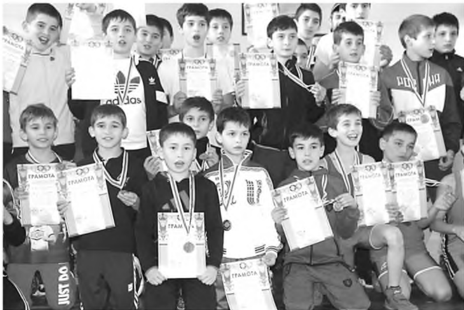
Победители и призеры Открытого первенства РДЮСШ по вольной борьбе среди юношей 2005-2006 годов.