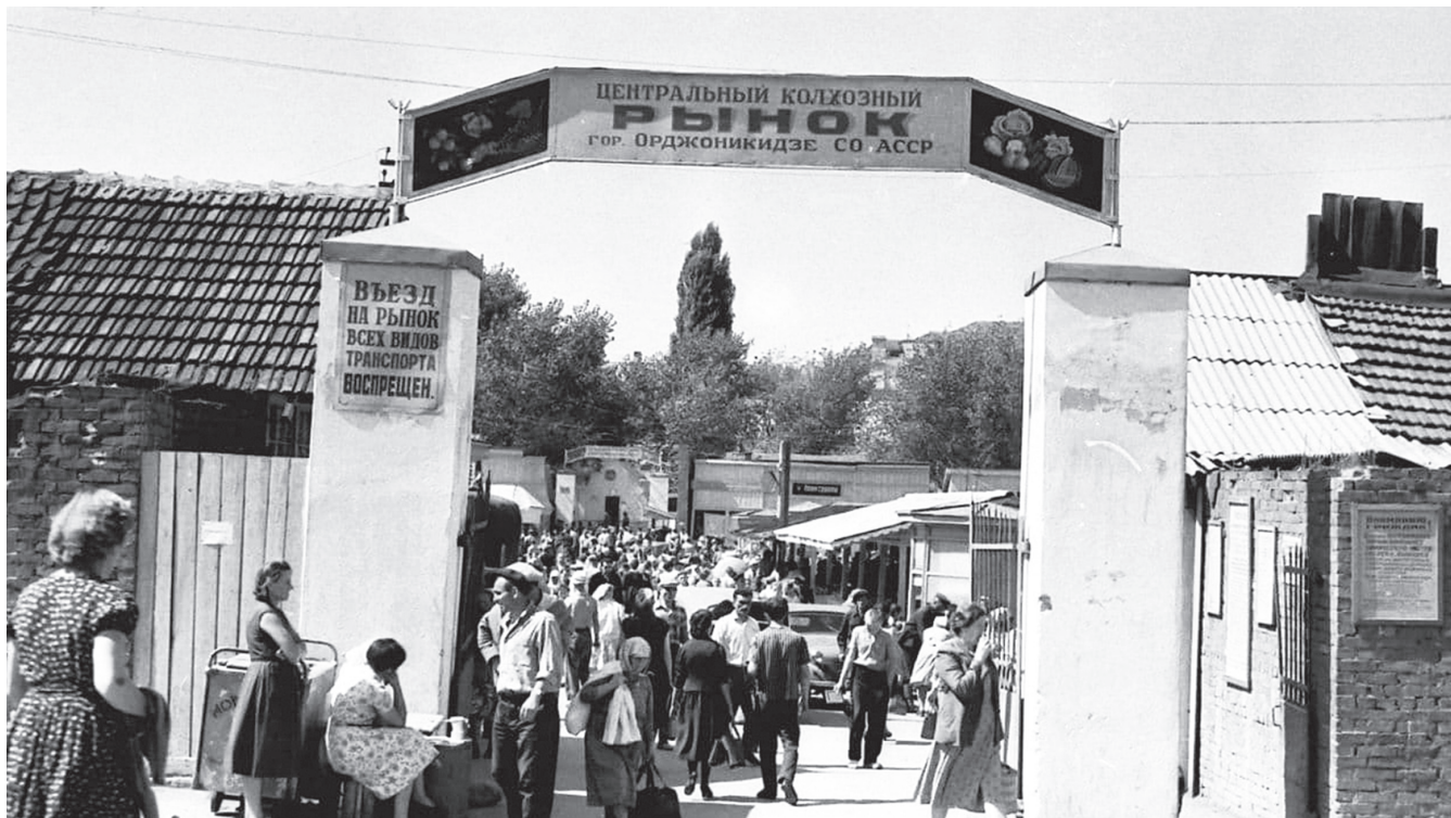
Орджоникидзе. Центральный рынок. 1961-1962 гг.

По вертикали: Киви. Перов. «Субару». Аттика. Сакля. Шов. Ажан. Едок. Агу. Орхус. Мез. Июнь. Анкаа. Индра. Аул. Тор. Ерд. Ик.