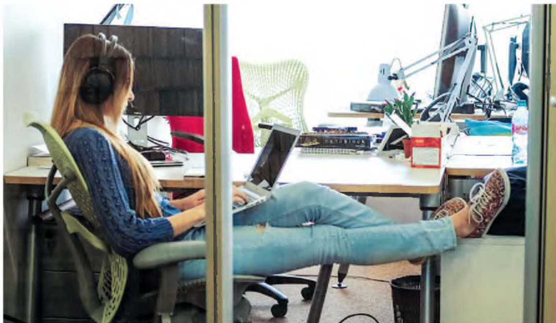
Был бесплатный кофе, чай, овощи, фрукты, печенки. Свободный график.

искать его нужно во Владикавказе, а не в Хабаровске.