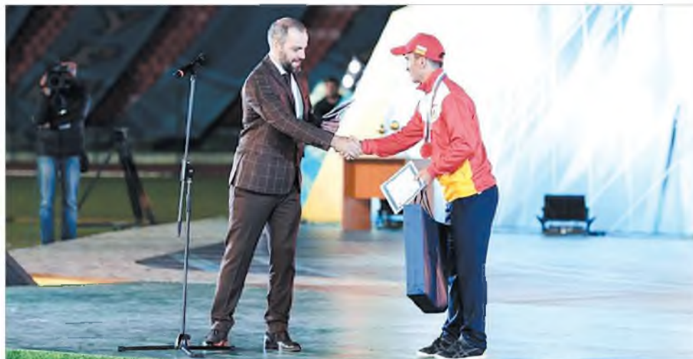
Спортсмен из Северной Осетии стал обладателем награды АО "КСК"

Торжественный старт кавказским играм предварило еще одно культурное мероприятие: открытие национальных подворий, которые вызвали наибольший интерес. Осетинским танцем "Хонга" гостей пригласили осмотреть экспозиции субъектов. В подворьях уже по традиции были представлены история, культура, декоративно-прикладное искусство народных мастеров, музейные экспонаты. Северная Осетия гостей встретила молитвой за тремя пирогами, пивом и осетинскими танцами. Республика представила интереснейшие экспонаты Нацмузея. Особо внимание