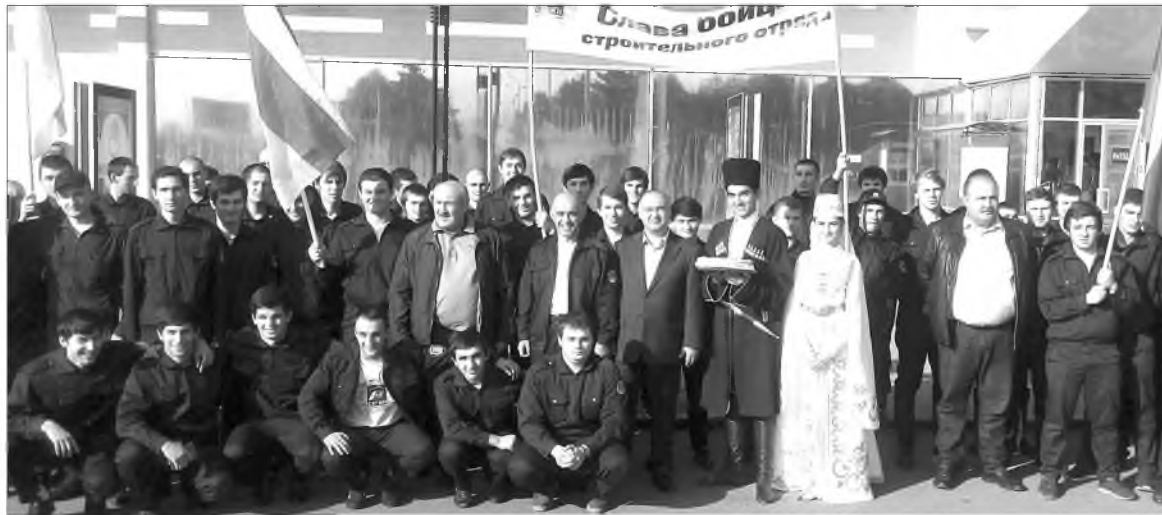
Участников студенческих отрядов по традиции встречали с тремя пирогами

Как всегда, работу на промышленных объектах студенты СКГМИ (ГТУ) активно совмещали с широкой культурной программой, посещая музеи,