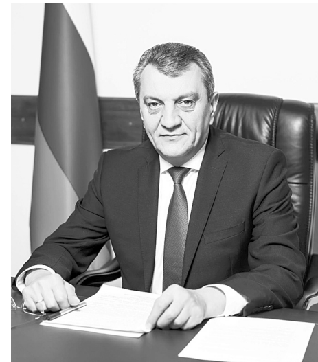
ГЛАВА РЕСПУБЛИКИ СЕВЕРНАЯ ОСЕТИЯ-АЛАНИЯ С.И.МЕНЯЙЛО

От всей души желаю вам крепкого здоровья, счастья, неиссякаемой энергии, успехов в вашей благородной деятельности и искренней любви ваших учеников! Пусть ваш труд продолжает приносить вам радость и удовлетворение.