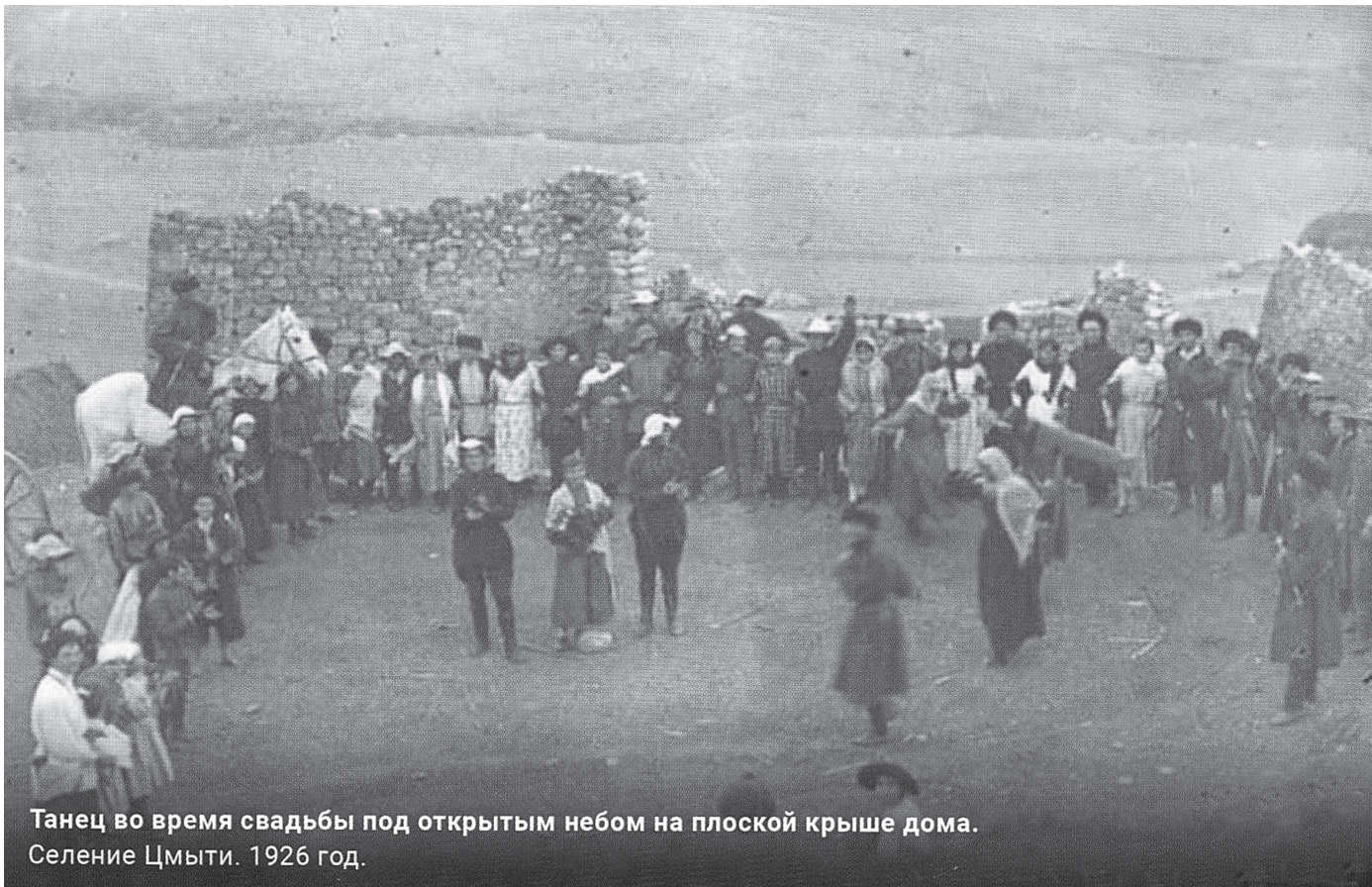
Танец во время свадьбы под открытым небом на плоской крыше дома. Селение Цмыти. 1926 год.

ФОТО ИЗГОТОВЛЕНО К 100-ЛЕТИЮ ОБРАЗОВАНИЯ РСО-АЛАНИЯ И ПРЕДСТАВЛЕНО КОМИТЕТОМ ПО ДЕЛАМ ПЕЧАТИ И МАССОВЫХ КОММУНИКАЦИЙ