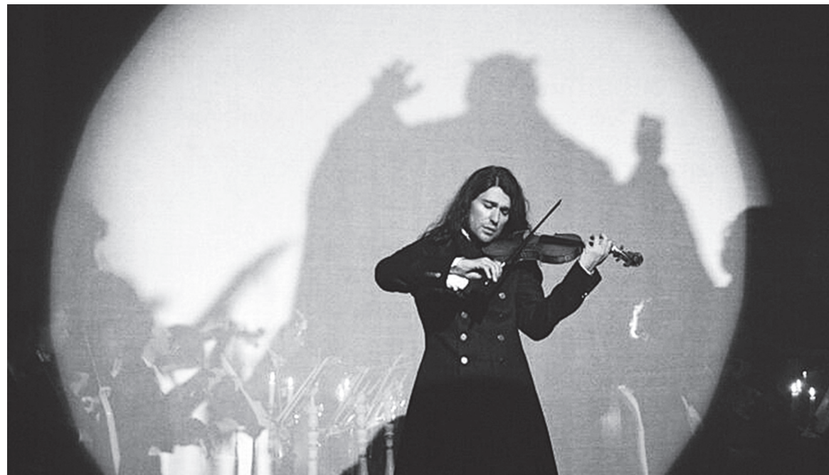
Кадр из фильма «Паганини. Скрипач Дьявола»

Шоу танцующего симфонического оркестра «Concorde Orchestra» планируют показать во Владикавказе 17 апреля 2024 года.