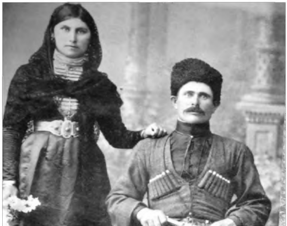
Григо æмæ Фона

Æфсымæры фæндыл хо сразы. Сæ хуыизист историмæ бацыд.