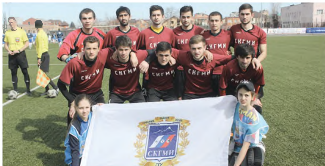
НСФЛ Высший дивизион (Первая группа), г. Владикавказ, 3-тур.