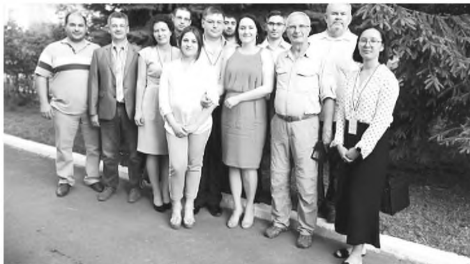
Участники конференции, приехавшие из разных регионов России