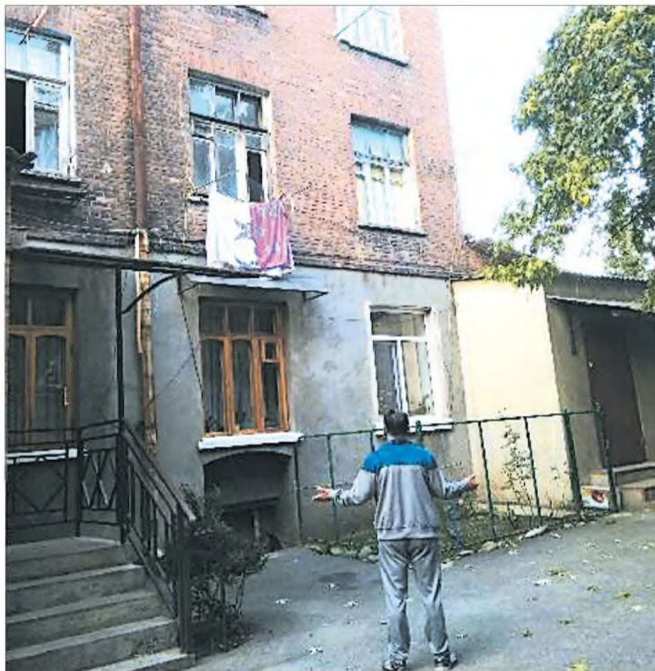
Именно этот дом жильцам предлагают снести самим

Муниципальная межведомственная комиссия обследовала и признала дом аварийным в феврале 2017 года. В середине сентября всем собственникам квартир прислали Требования от органа местного управления, в которых и предписывают снос за свои средства. Стоит отметить, что нынешний Жилищный кодекс РФ предусматривает снос аварийных домов за счет собственника. То есть, по сути, администрация действует в соответствии с законом, согласно которому люди могут легко лишиться жилья: достаточно признать дом аварийным или земельный участок под ним, подлежащим изъятию для государственных или муниципальных нужд.