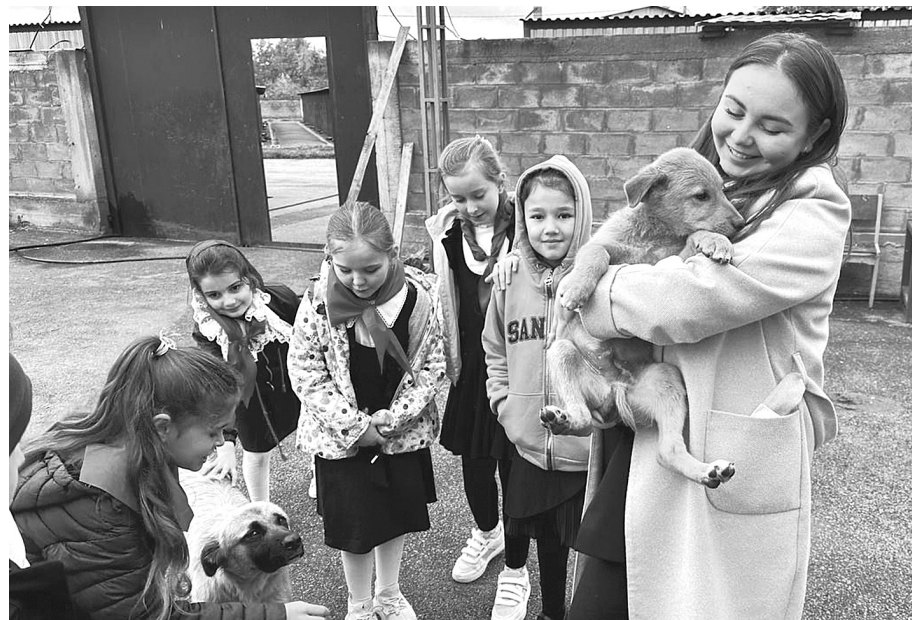
Учащиеся Владикавказской школы №27 посетили питомник с гостинцами для его обитателей

уехали к представителям агропромышленного комплекса, две собаки - к равнодушным жителям города.