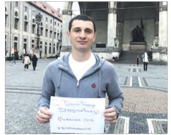
ПРЕСС-СЛУЖБА АМС Г. ВЛАДИКАВКАЗА