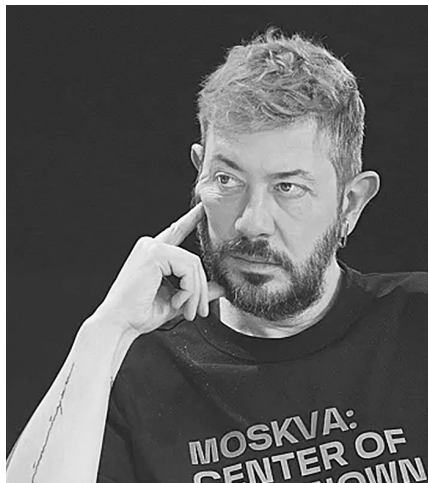
говорят: «Ну это же ответка». У них ничего не екает даже!

У людей, которые сидели и два года обсуждали войну на Украине, и говорили «Какой кошмар!», постили фотографии каких-то разрушенных балконов, когда там полстраны снесли – они