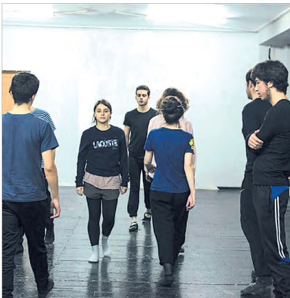
Кто он - современный осетинский подросток? Что у него болит, что его мучает или радует? Эти вопросы интересно задавать на территории театра.

Идея проведения "Театральной лаборатории 12+" родилась еще два