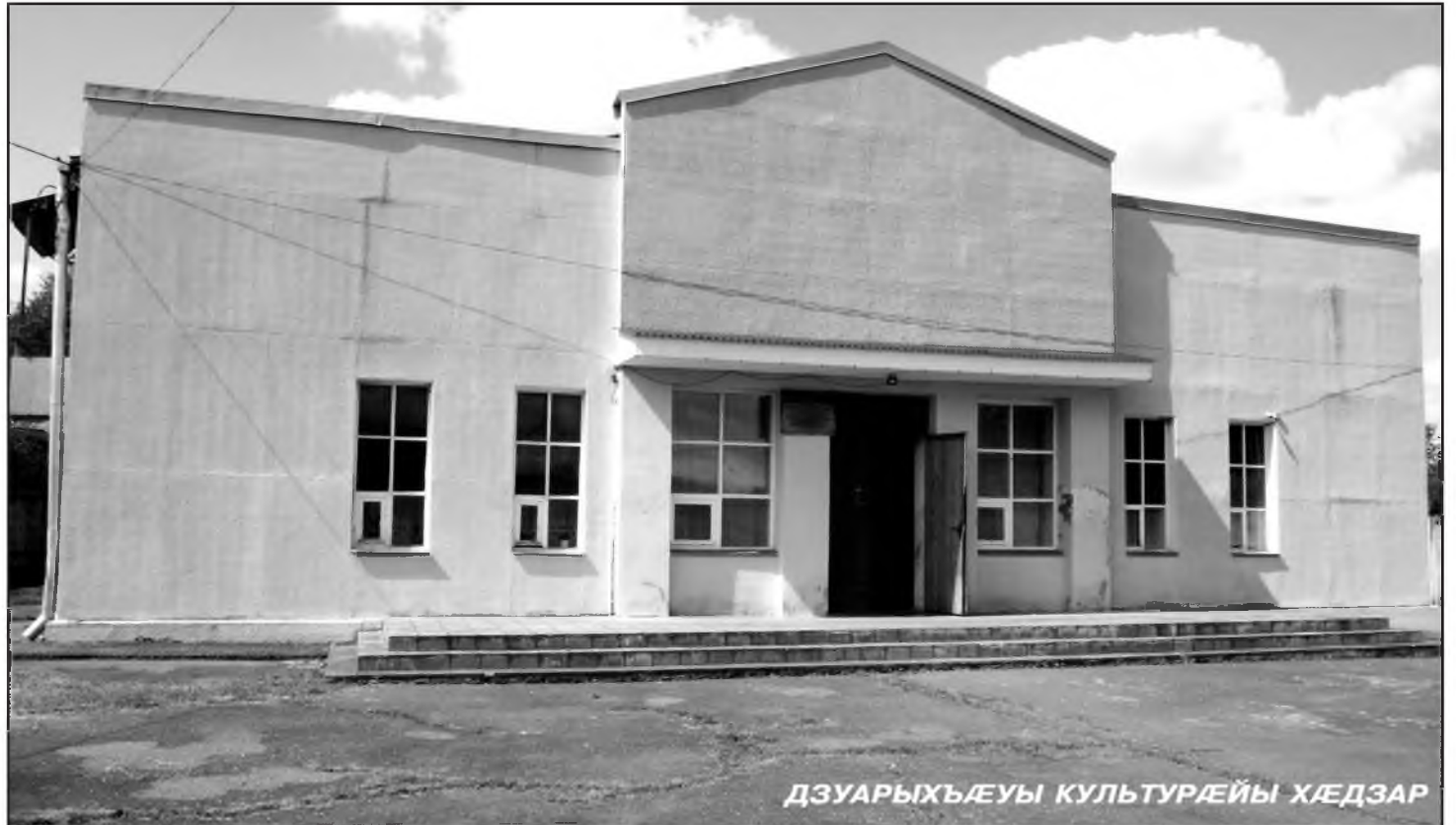
ДЗУАРЫХЪÆУЫ КУЛЬТУРÆЙЫ ХÆДЗАР

Фæрниаты Маринæ культурæйы ардзæсты разамонæг фыццаг аз нæу. Хъуыддажы æнтыстыл зæрдигæй кæй архайы, уый йæ куыстыл бæрæг дары. Йæ коллектив стыр нæу. Кæрæдзийы мидæг сæ хæлар