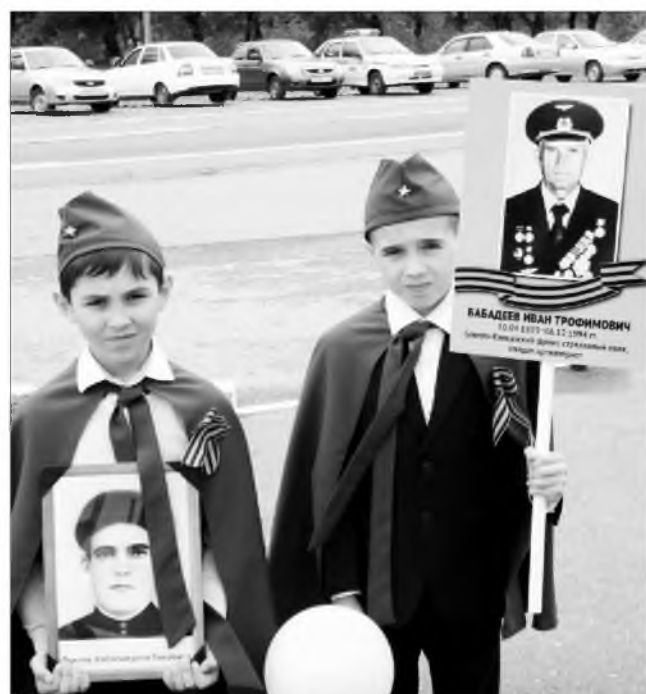
Фæрз бацæттæ кодта ДЗУЦАТЫ Къоста. Авторы ист къамтæ