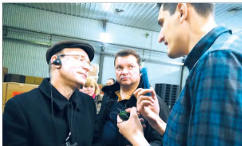
Сотрудники "Фат-Агро" рассказывают об уникальности своего производства представителям компании