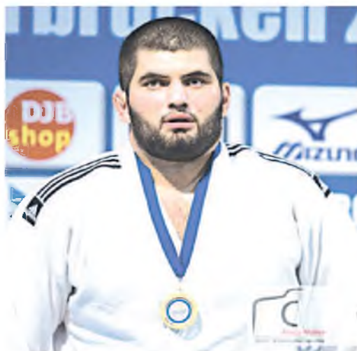
Кубок Европы - 2017. В/к +100 кг