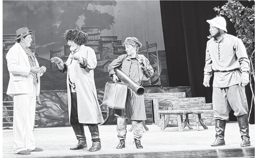
Репетиция спектакля «Нафи æмæ Нафигайы чызджытæ»