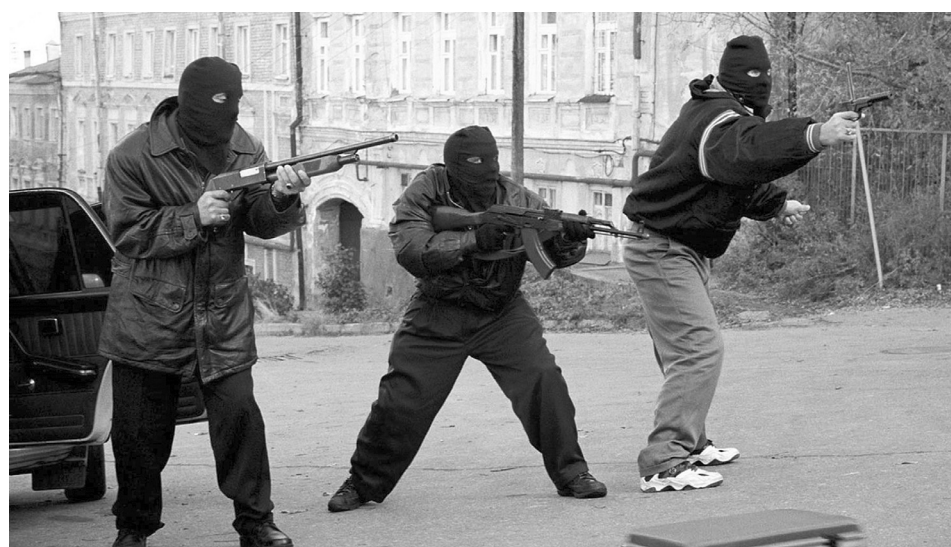
Кадр из фильма «Жмурки», 2005 г.

Еще одно правило поведения джигита в момент конфликта строжайше запрещало обнажать клинок в той ситуации, когда его практическое применение было под вопросом - предполагалось, что любой, даже самый острый спор можно решить путем переговоров, поисков взаимовыгодных компромиссов. И лишь тупиковая ситуация, возникшая в процессе попытки решить вопрос мирным путем, могла привести к при-