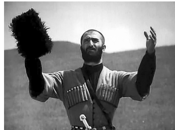
Кадры из фильма «Хохаг», 1992 г.