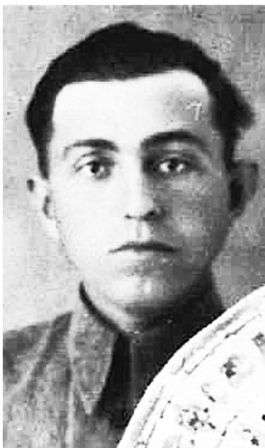
Фото времен войны

В послевоенное время несколько десятков лет вплоть до выхода на заслуженный отдых проработал на руководящих должностях в органах прокуратуры Северо-Осетинской АССР и Татарской АССР. За безупречную службу по охране законности имеет правительственные и ведомственные награды и поощрения.