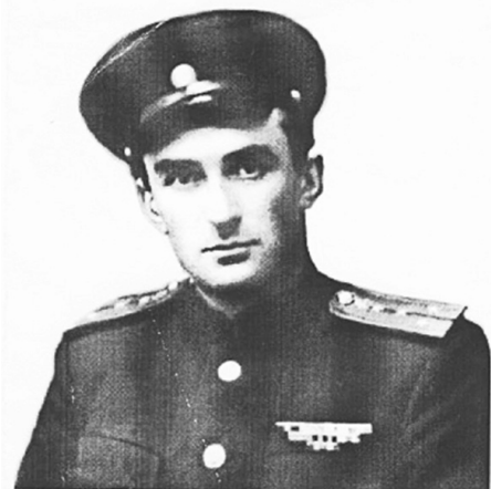
Фото начала 60-х годов

Вернувшись на родину в с. Эльхотово, назначен на должность директора районной типографии. Затем был избран первым секретарем Кировского районного комитета ВЛКСМ. Снова призван на военную службу в 1950 году и до начала 60-х годов служил на Дальнем Востоке — на острове Сахалин, Курильских островах, полуострове Камчатка, а также в Закавказье.