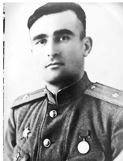
Фото 1944 года