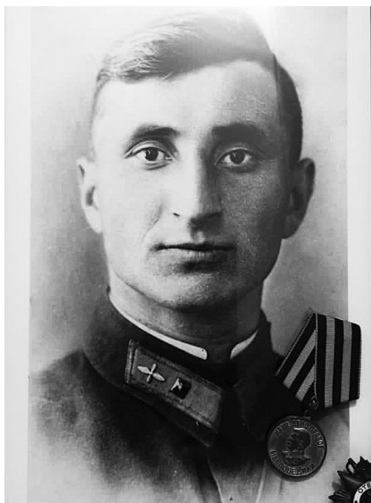
Фото 1939 года

После окончания Великой Отечественной войны освоил профессию токаря, работал на промышленных предприятиях в городах Орджоникидзе (Владикавказ) и Нальчик. За высокие производственные показатели, трудовую доблесть и плодотворную общественную деятельность награжден орденом «Знак Почета» и медалями.