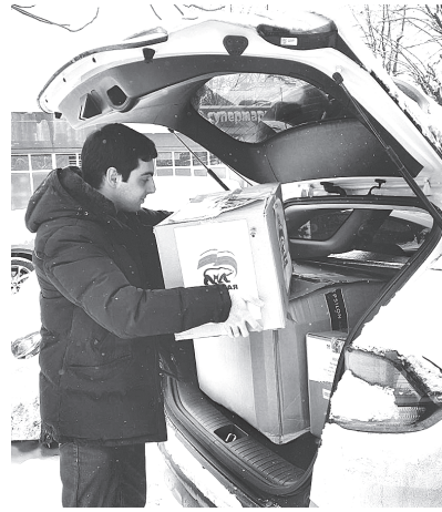
с Днем защитника Отечества и поблагодарить их за то, что защищают интересы нашей страны».