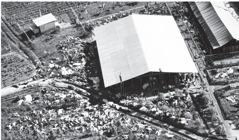
Тела 900 последователей «Храма народов», отравившихся цианидом. Самый массовый суицид в истории человечества

Про секту «Храм народов» обычно говорят – адская секта в райских джунглях. Поначалу руководитель секты Джим Джонс проводил свои паствы только на территории США, но позже, когда секта начинала набирать обороты и популярность, стала подвергаться критике и гонениям. Тогда Джонс перевез 900 последователей в Джонстаун (Гайана). Стоит отметить, что