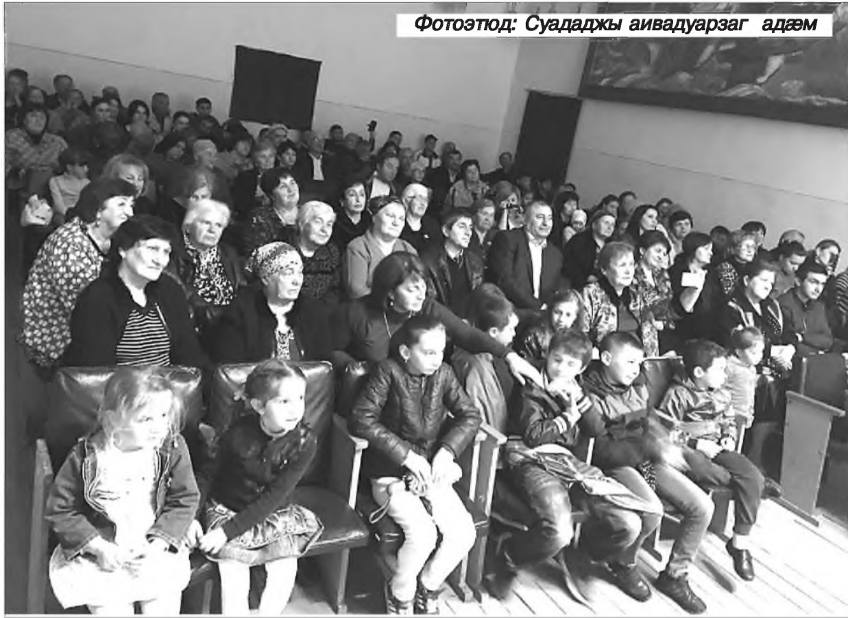
Фотоэтюд: Суададжы аивадуарзаг адæм