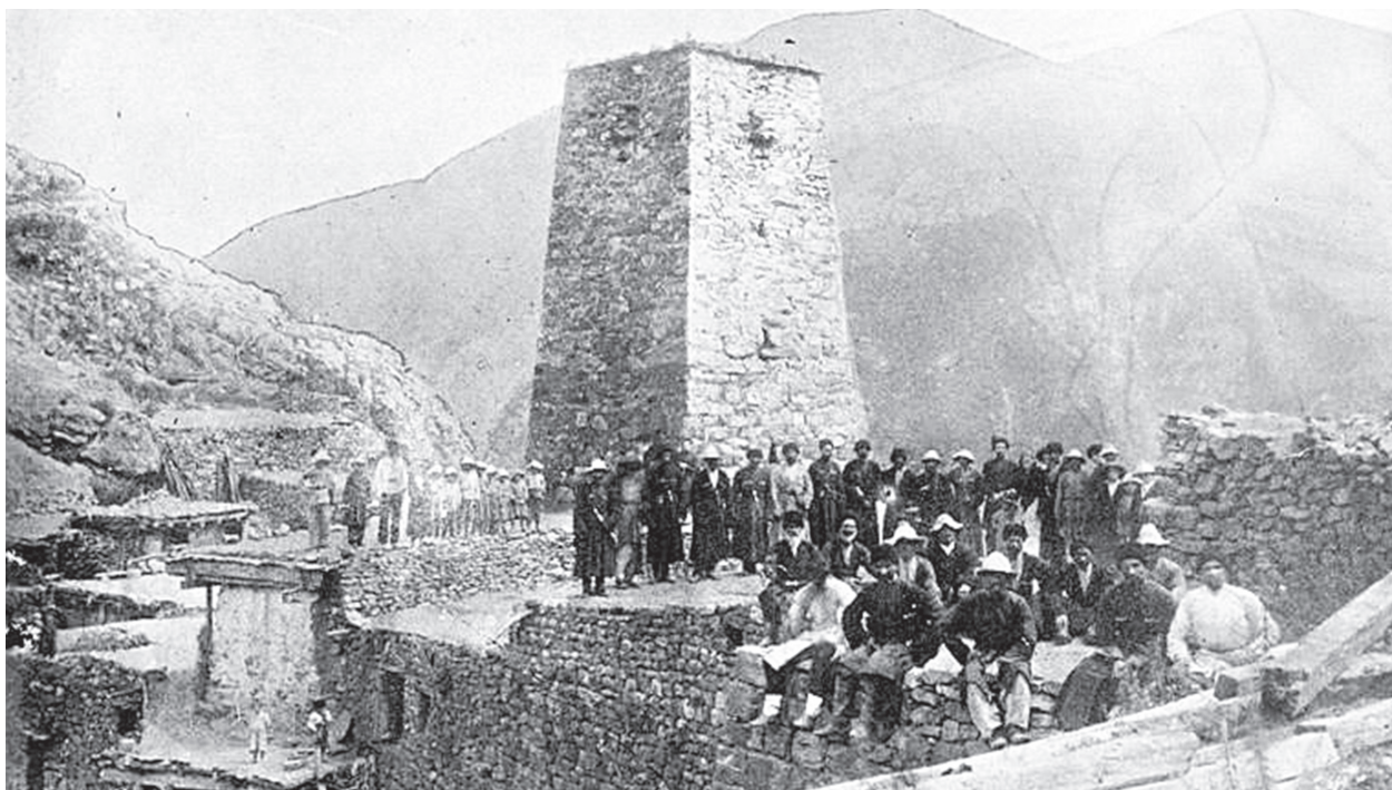
Военно-Осетинская дорога. Аул Холст. Северная Осетия.