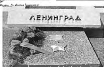
Медаль за оборону Ленинграда