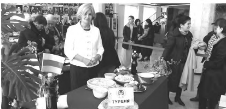
Фæрсаг бацæттæ кодта ДЗУЦЦАТЫ Къоста.