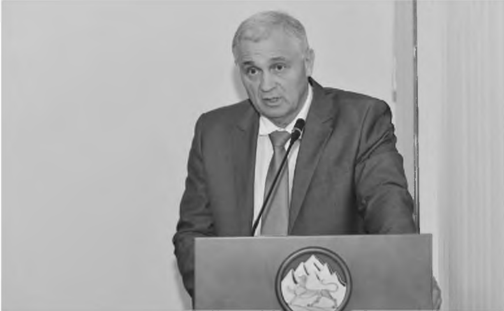
Министр финансов республики Казбек Царикаев докладывает параметры бюджета на 2018 г.

"В целом, бюджет республики по-прежнему сохраняет свою социальную направленность. На отрасли социальной сферы планируется направить 74% всех расходов на 2018 год", - сказал он.