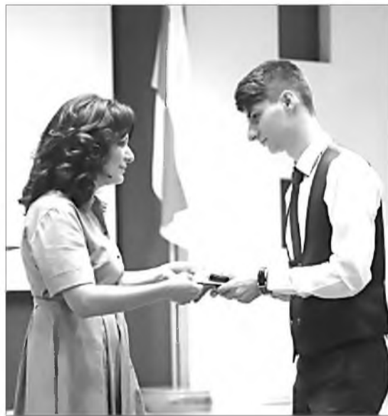
труд своих педагогов, которые на протяжении долгих лет старались вам прививать вкус к истинным ценностям!" - сказал он.

"В целом по Владикавказу 213 медалистов. Я искренне поздравляю всех и хочу пожелать исполнения заветных желаний. Чтобы вы были гордостью родителей и оправдали