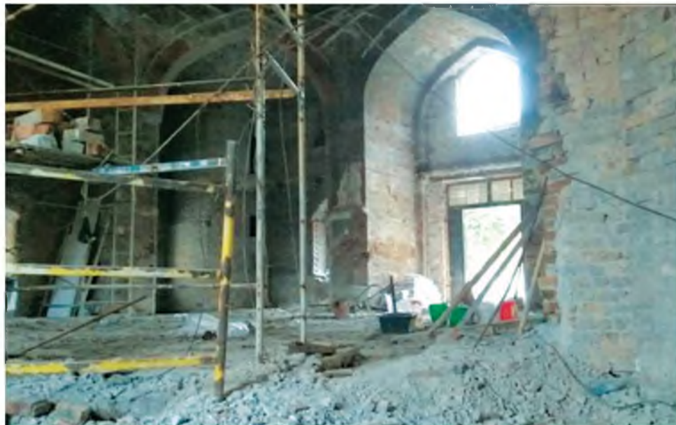
Ремонтные работы в самом разгаре