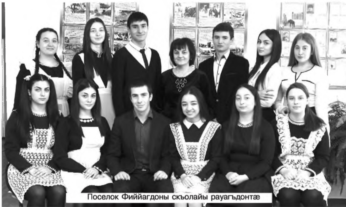
Поселок Фиййагдоны скъолайы рауагдонтæ

Фæндараст ут, нæ рæсугъд кæстæртæ, цард уын æнтысæд.