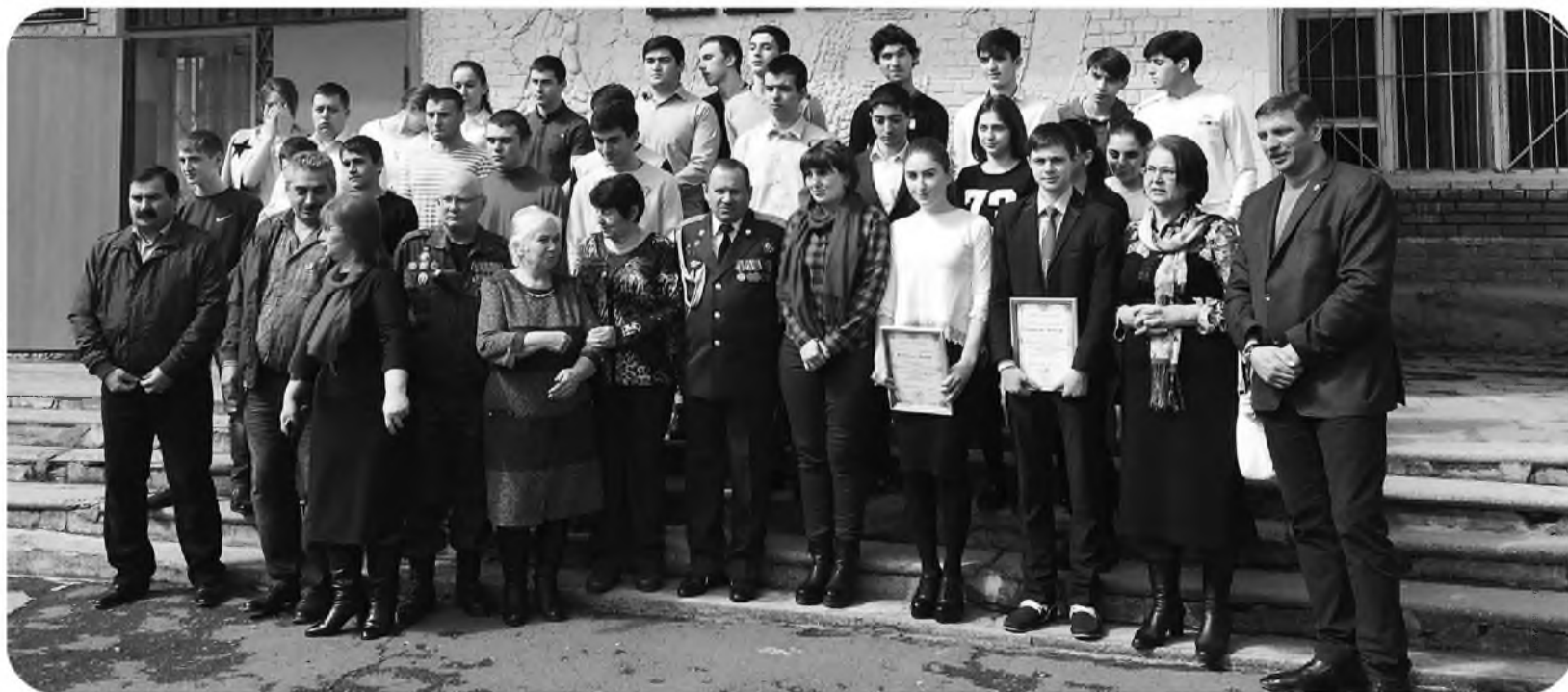
В конце мероприятия все участники сделали совместное фото на память.