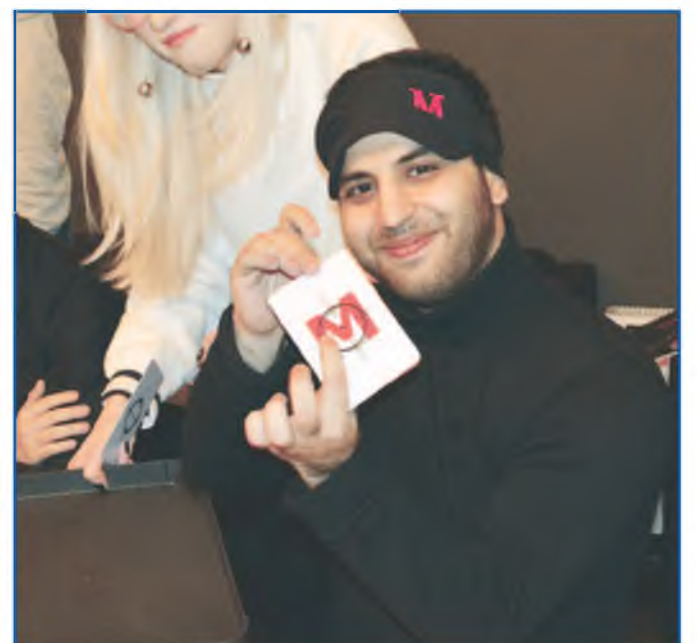
Полосу подготовила Дзерасса ГАГЛОЙТЫ