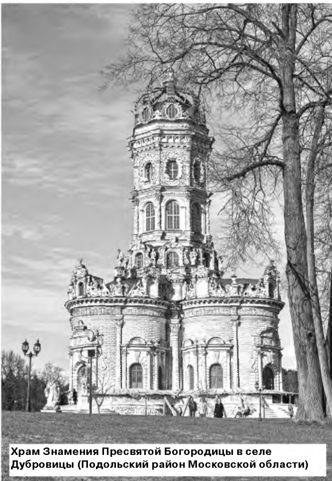
Храм Знамени Пресвятой Богородицы в селе Дубровицы (Подольский район Московской области)

Император был любителем всего необыкновенного и решил увидеть столь удивительное семейство. "Если то, что о них говорят - правда, то пусть они украсят своим присутствием жизнь во дворце", - решил он и приказал привести Софию с дочерьми.