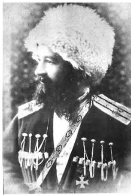
Полковник В.Д.Хестагуров, командир Осетинского конного полка. 1917 г.

- Мне всегда был близок видный деятель истории России и Осетии времен революционной смуты, терский казак-осетин станицы Ново-Осетинской генерал Лазарь Федорович Бичерахов.