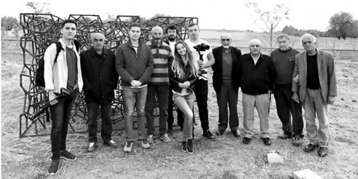
С турецкими осетинами в селении Рогузлі на фоне арт-объекта, посвященного жертвам теракта в Беслане, который был создан участниками владикавказского творческого объединения "Портал" во время их путешествия на велосипедах в Турцию

К концу года съемочная группа из Челябинска презентует в Северной Осетии фильм о жизни осетинской диаспоры в Турции.