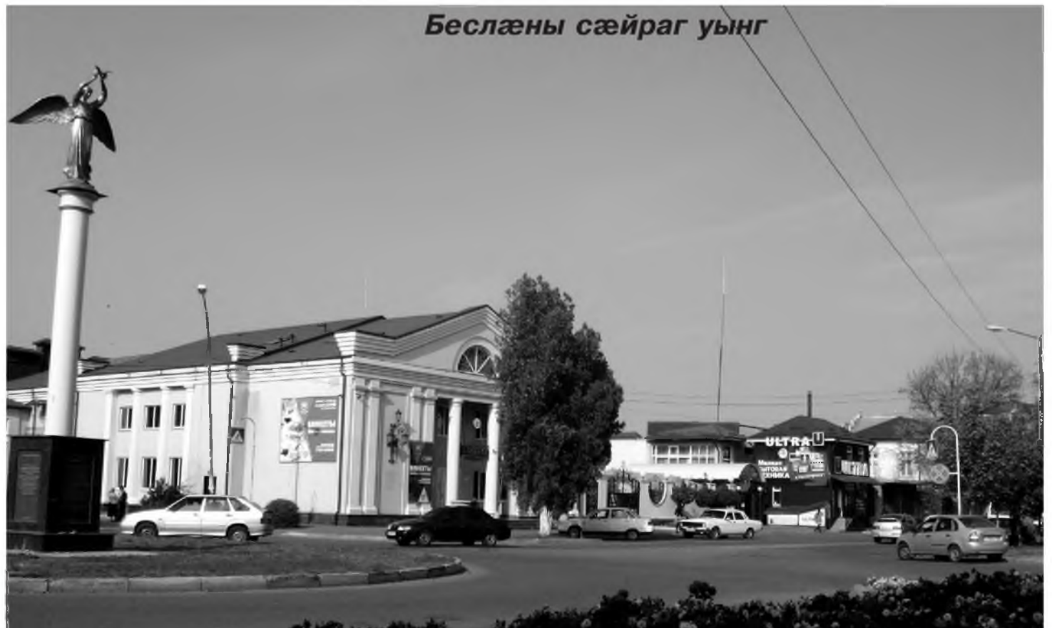
Фарс бацæттæ кодта ДЗУЦЦАТЫ Къоста