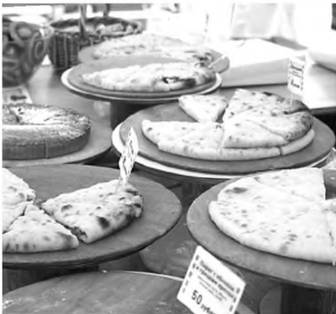
В прошлом году лавка с осетинскими пирогами пользовалась у хабаровчан популярностью

Более 400 осетинских пирогов с картошкой, сыром и мясом планируется испечь за два дня в Хабаровске на выставке-ярмарке "Наш выбор 27", будут развернуты креативные зоны народов, проживающих в Хабаровском крае, а также палатки с продуктами и ресторанные дворики.