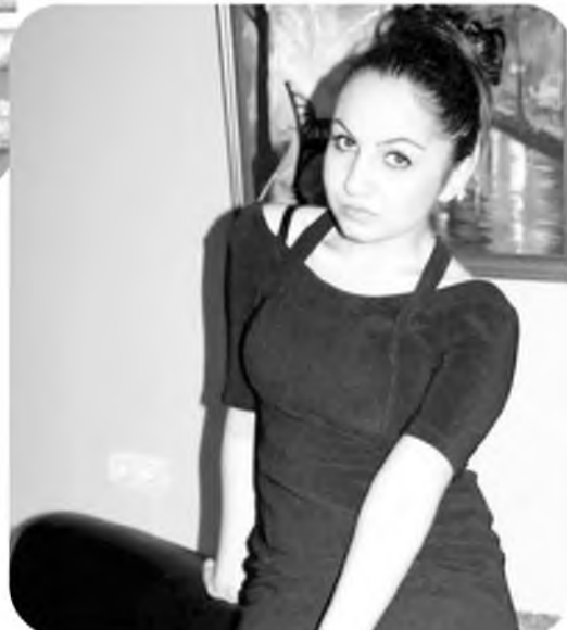
Полосу подготовила Фатима КУЧИЕВА

- После экзаменов я немножко отдохнула, а потом захотела поработать. Долго не могла найти ничего подходящего. А потом мне предложили присматривать за детьми. Я согласилась. У меня маленький брат, я всегда с ним справлялась. И с этими детками быстро нашла общий язык. Пока их родители на работе, я кормлю их, гуляю и укладываю спать.