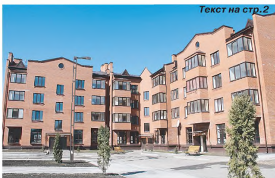
Текст на стр.2