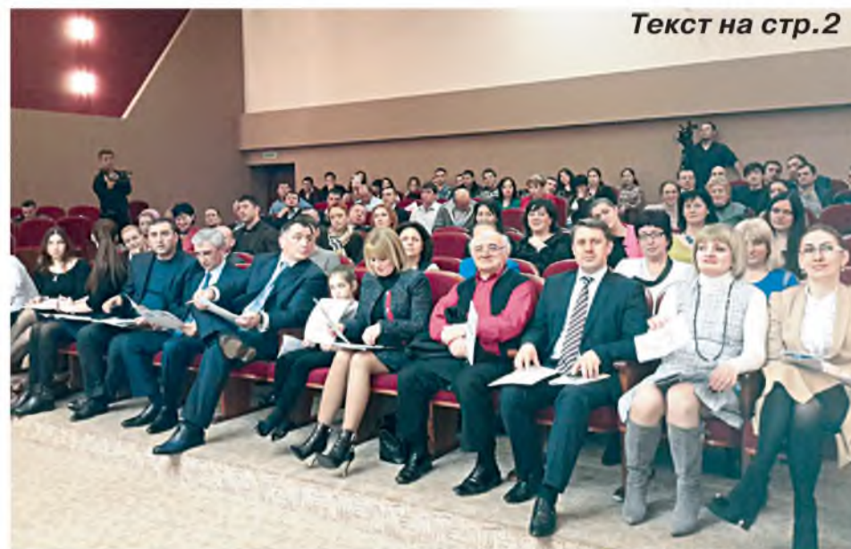
Текст на стр.2