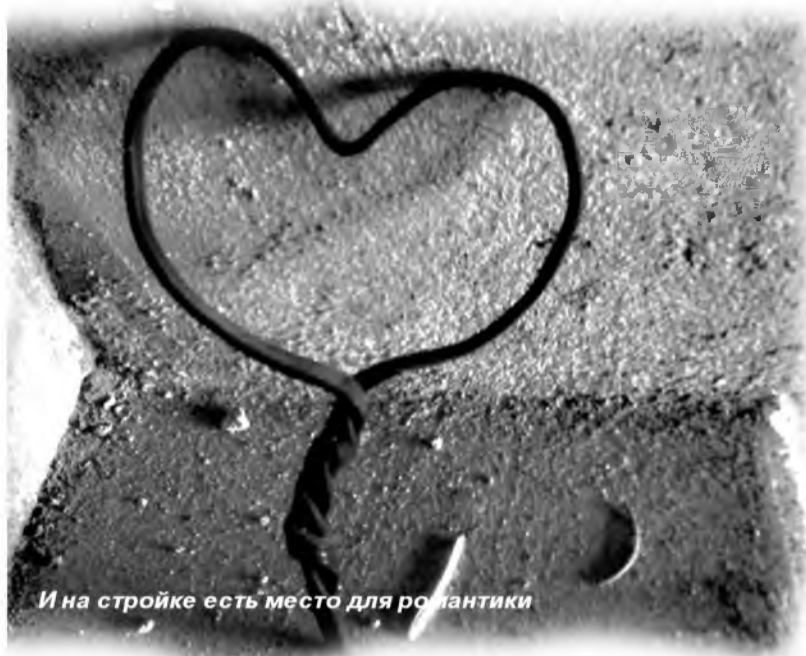
И на стройке есть место для романтики