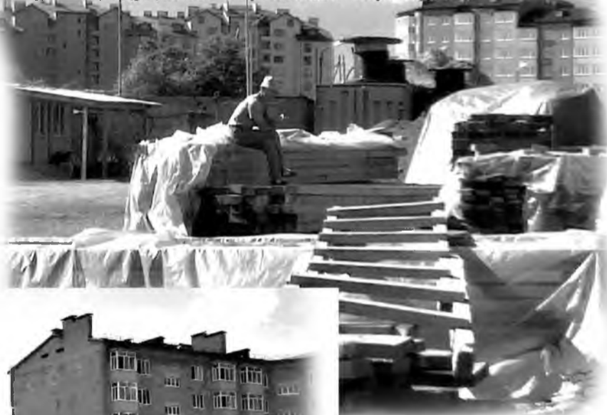
Мужчина, ждущий своего рейса Нью-Йорк-Париж