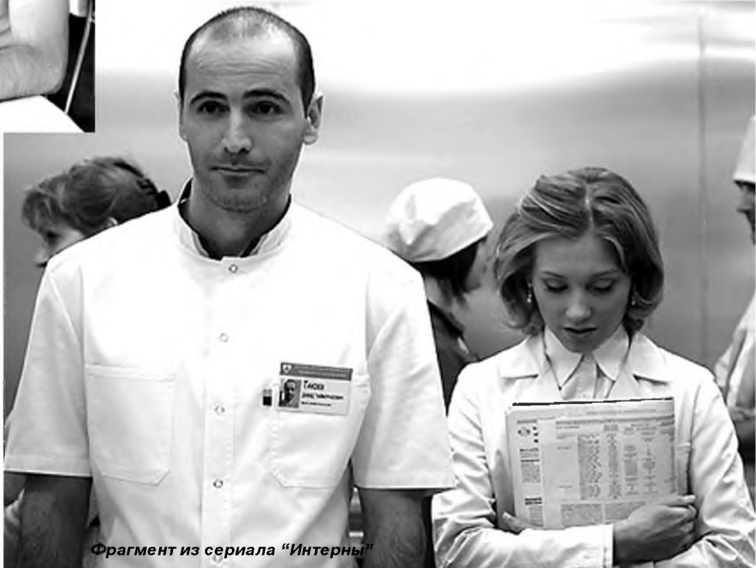
Фрагмент из сериала "Интерны"