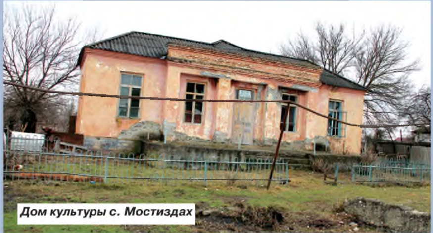
Дом культуры с. Мостиздах