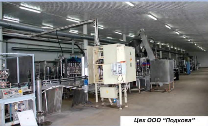
Цех ООО "Подкова"