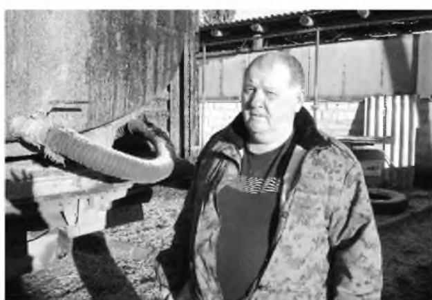
Майрæмадаггаг фермер Плиты Хетæг

Фарс бацæттæ кодта ДЗУЦЦАТЫ Къоста. Авторы ист къамтæ