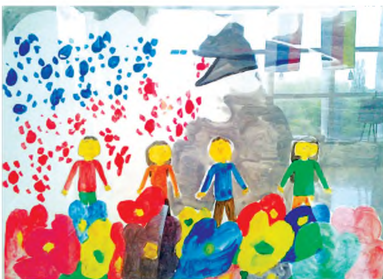
Текст на стр. 7