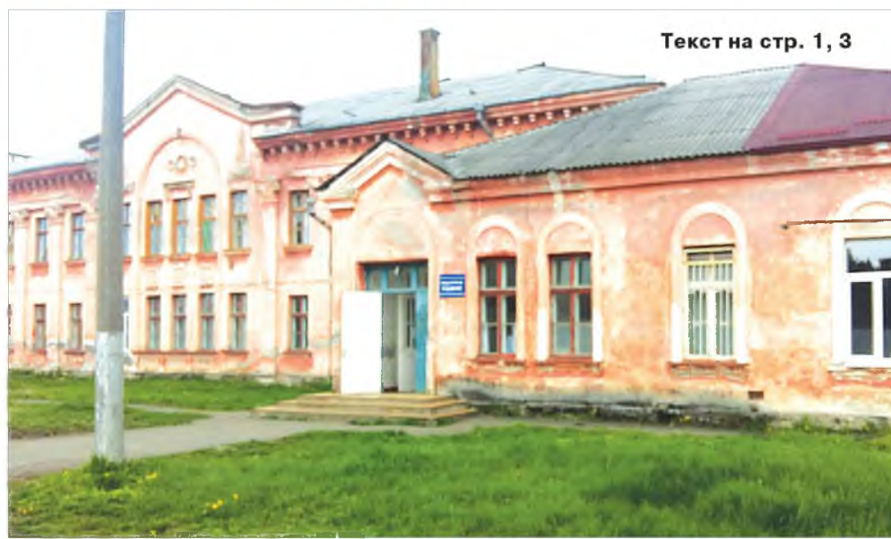
Текст на стр. 1, 3