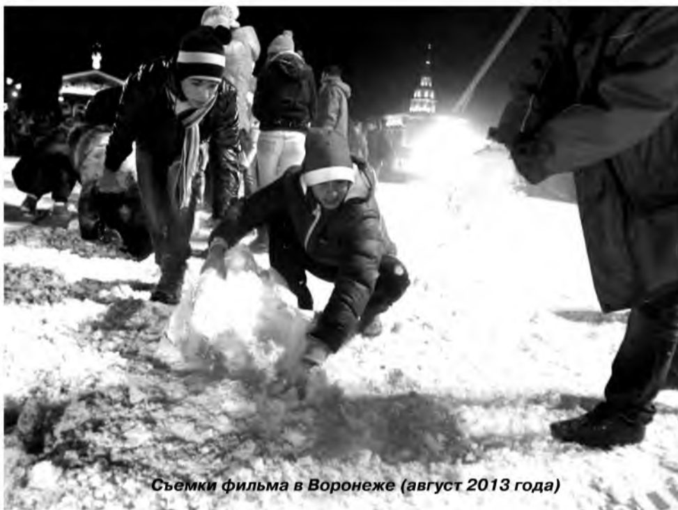
Съемки фильма в Воронеже (август 2013 года)