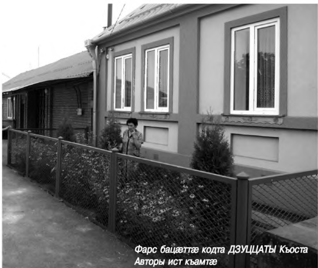
Фарс бацæттæ кодта ДЗУЦАТЫ Къоста Авторы ист къамтæ