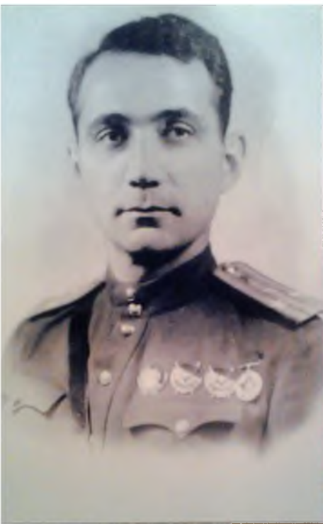
Х. Д. Мамсуров - полковник. 1943 г.