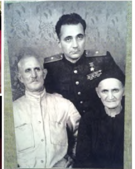
Х. Д. Мамсуров - Герой Советского Союза с родителями