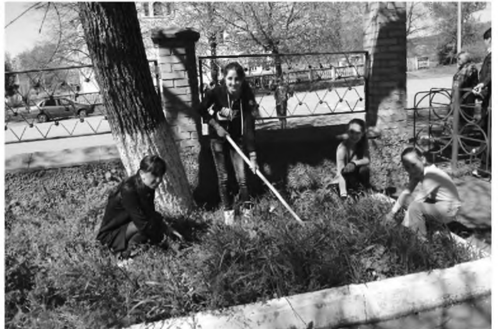
Бруты æмæ Заманхъулы скъолаты зиуы бон