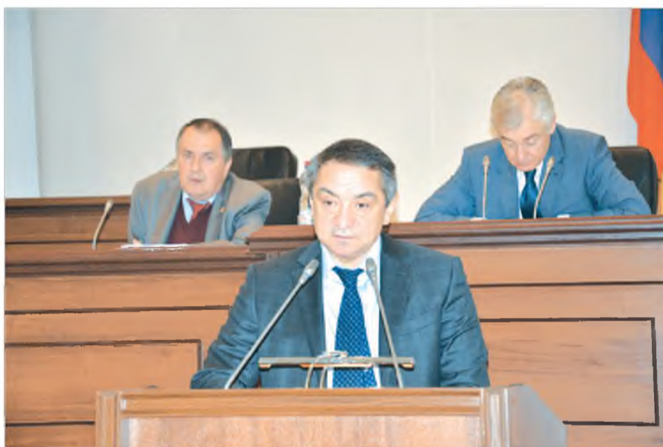
И. О. министра финансов Северной Осетии Олег ИСАКОВ

По представленному отчету министра, дефицит бюджета на выплату заработной платы составляет 1 миллиард 372 миллиона рублей. Кредит будет выделен из федерального бюджета в размере 1 миллиард 50 миллионов и средств республиканского бюджета, полученных в результате сокращений расходов бюджета в сумме 532 миллиона рублей. Для полного погашения